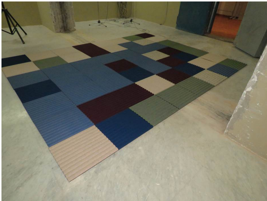
Foto durante il test / Photo during the test