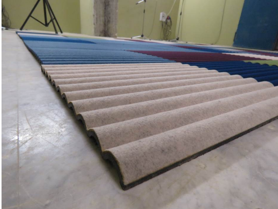
Dettaglio / Detail